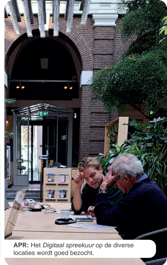
APR: Het Digitaal spreekuur op de diverse locaties wordt goed bezocht.