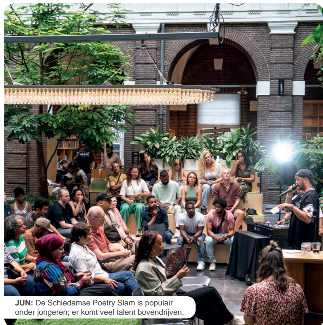
JUN: De Schiedamse Poetry Slam is populair onder jongeren; er komt veel talent bovendien.