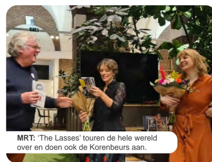
MRT: 'The Lasses' touren de hele wereld over en doen ook de Korenbeurs aan.