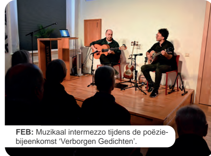
FEB: Muzikaal intermezzo tijdens de poëziebijeenkomst 'Verborgen Gedichten'.