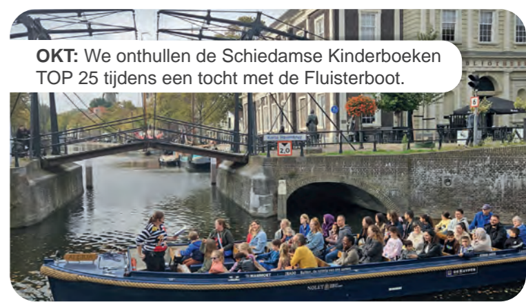
OKT: We onthullen de Schiedamse Kinderboeken TOP 25 tijdens een tocht met de Fluisterboot.