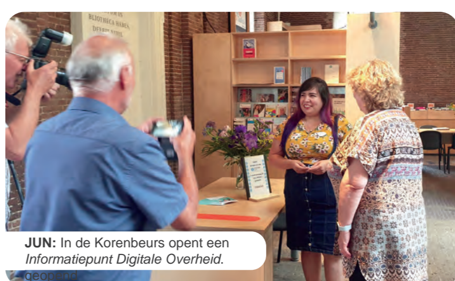
JUN: In de Korenbeurs opent een Informatiepunt Digitale Overheid .