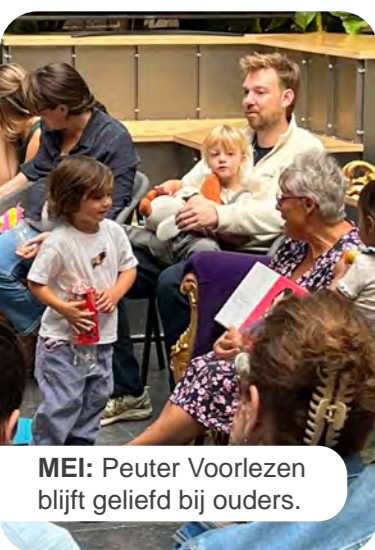
MEI: Peuter Voorlezen blijft geliefd bij ouders.