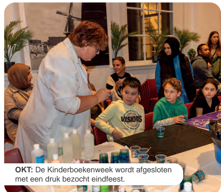
OKT: De Kinderboekenweek wordt afgesloten met een druk bezocht eindfeest.